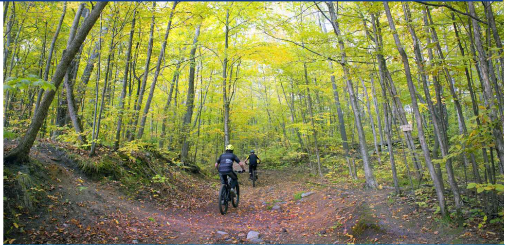
L'aire de conservation de l'escarpement laurentien