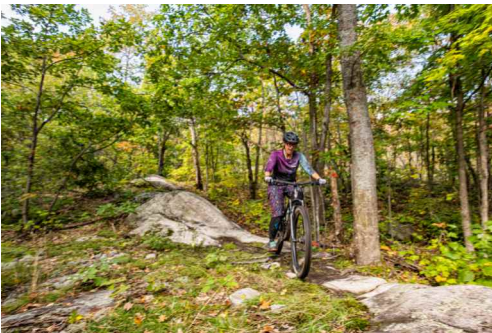
Réseau de sentiers Three Towers

Ces sentiers non gérés offre des boucles extérieures et intérieures avec des montées, des descentes et des rochers techniques à traverser.