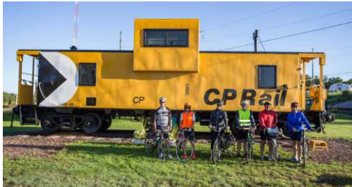
C'est à Bonfield qu'on retrouve le premier crampon de rail du Chemin de fer

Le parcours débute en toute facilité en sortant de North Bay le long d'un sentier pavé et rencontre la tranquillité des chemins de campagne de Callander marqués des enseignes de la Véloroute Voyageur. On croise souvent d'autres cyclistes sur ce bout de chemin en direction d'Astorville à la recherche des charmantes rives du nord-est du lac Nosbonsing et du calme des paysages ruraux. Bonfield est un bon point de départ si les randonnées sur chemins de gravier sont l'activité recherchée. C'est aussi le dernier poste de ravitaillement avant d'arriver à Mattawa! À partir de Bonfield, des terres agricoles à perte de vue sont entremêlées de vastes étendues de forêt et de terres sauvages. Le chemin se transforme en magnifique route de gravier ondulante jusqu'à Mattawa ou presque.