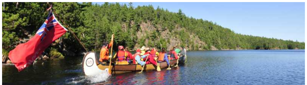
Grâce à ses liens avec l'histoire des Premières Nations, l'exploration du Canada et la traite des fourrures, la rivière Mattawa est l'une des rivières patrimoniales du Canada.