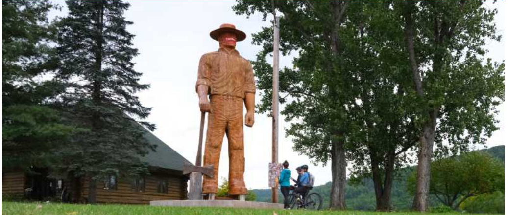
Des statues sculptées à la main représentant de grands personnages historiques arborent l'est de la piste cyclable. On voit ici Jos Montferrand érigé dans le parc Explorer's Point à Mattawa.

Les bornes de réparation en libre-service à Astorville, Bonfield, Eau Claire et Mattawa. Boutiques de vélos à services complets à North Bay.