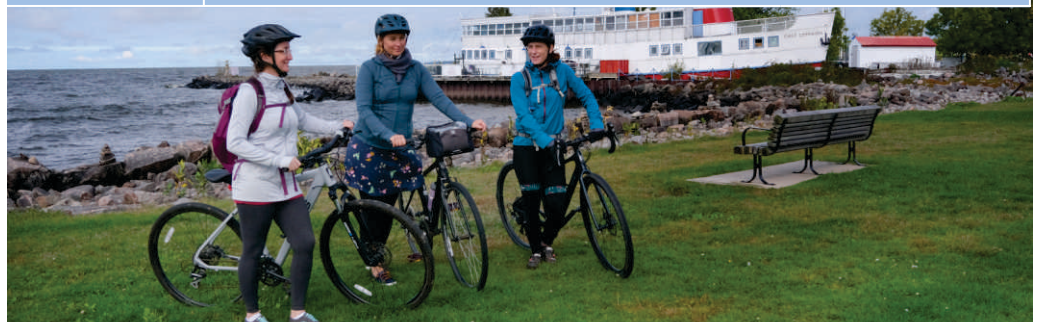
Le lac Nipissing est une grande source d'inspiration pour la communauté artistique.