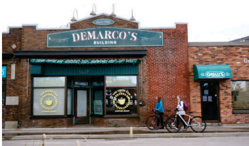
Le North Star Diner, situé dans le bâtiment historique de Demarco, avec ses œuvres d'art originales et son décor excentrique, mérite une visite.

Deux sentiers pavés à usages multiples, le Kate Pace Way et le Kinsmen Trail, mènent les cyclistes au cœur de la ville. Attardez-vous dans le centre-ville avec ses murales colorées et ses boutiques et galeries uniques célébrant les arts locaux, les articles artisanaux et la cuisine du Nord. Le trajet jusqu'à l'extrémité nord de la ville emprunte des routes municipales à circulation modérée. Pour une randonnée plus longue, il existe quelques options qui font une boucle entre la baie nord du lac Nipissing et sa rive sud accidentée. Le village de Callander, favorable à la bicyclette, possède un certain nombre de délicieux restaurants à terrasse appartenant à des habitants locaux. L'itinéraire suit des routes secondaires tranquilles avec de larges accotements pavés et de légères montées et descentes. Vous pouvez également vous diriger vers l'est en direction d'Astorville, le long de la route cyclable Voyageur, et faire une boucle en passant par la communauté de Corbeil, le long des larges accotements pavés de la route 94.