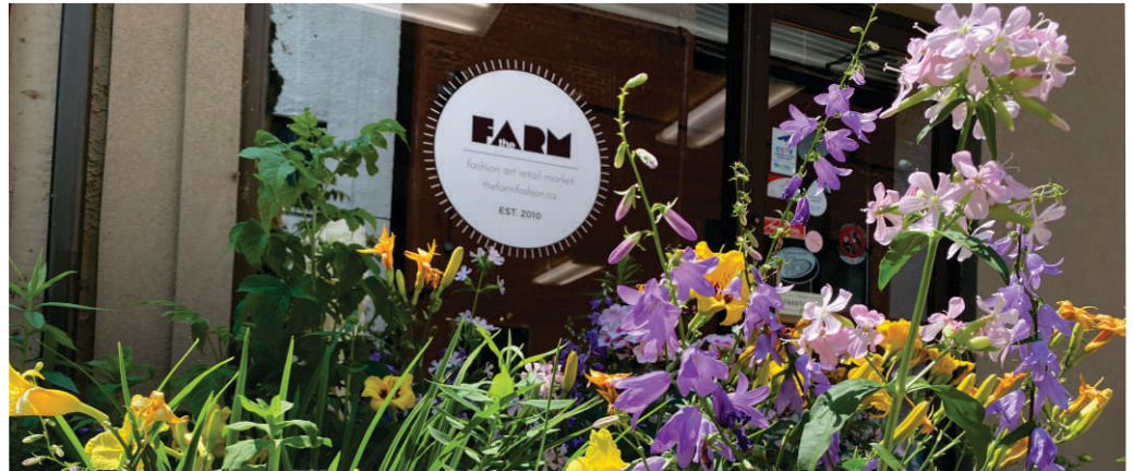
Le centre-ville de North Bay présente des murales colorées et des boutiques et galeries d'art uniques qui célèbrent les arts locaux, les objets artisanaux et la cuisine nordique.

Boutiques de vélos à services complets à North Bay.