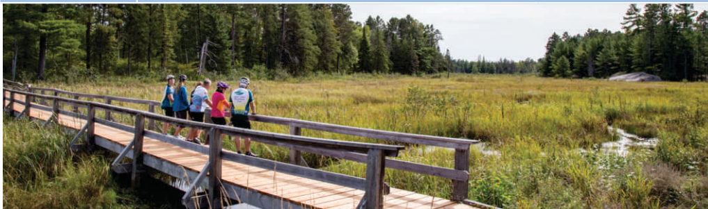
On peut accéder facilement au sentier Loudon Peatland du parc provincial Mashkinonje à partir de la Route 64. Cette courte randonnée le long du sentier d'interprétation en vaut bien le petit détour.