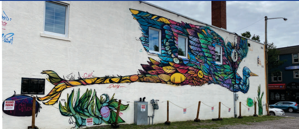
Découvrez l'histoire de Nipissing Ouest grâce aux peintures murales et aux portraits communautaires uniques.

Les bornes de réparation en libre-service à Sturgeon Falls, Lavigne, Noëlville et St. Charles. Behind Bars: boutique de ventes et services de vélos et de planches à Sturgeon Falls.