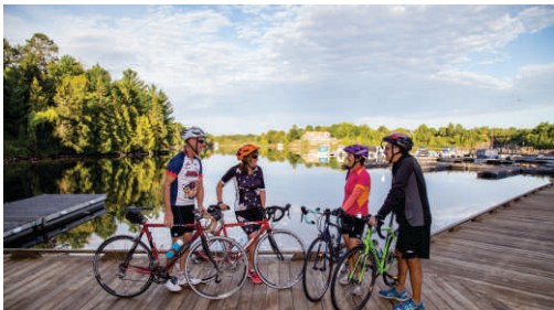
La baie Minnehaha à Sturgeon Falls est une aire de préparation idéale où commencer le trajet.

À partir de Sturgeon Falls, la route longe des chemins de campagne où se trouvent des fermes sur la Véloroute Voyageur. La Route 64 a de larges accotements et les voitures y sont peu nombreuses. Elle serpente sur le bras ouest du lac Nipissing pour ensuite pénétrer dans la nature sauvage du Nord de l'Ontario. Les petites communautés du Nord qui se trouvent sur le chemin offrent des casse-croûtes et des cafés en bordure de route pour une collation sur le pouce, ou encore des aires de repos sur le bord du lac où l'on peut puiser dans la paix du paysage boréal. À partir de Noëlville, le trajet en direction nord a de longues montées. Le parcours de Warren à River Valley et Field sur la Route 539 peut être cahoteux. Apportez un pneu de rechange ou une trousse pour crevaison et n'oubliez pas de prendre garde aux ours! Longez la rivière Sturgeon pour faire la boucle.