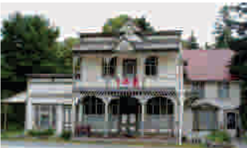
Commanda Heritage Centre

Cette section est constituée de routes secondaires municipales bien entretenues.